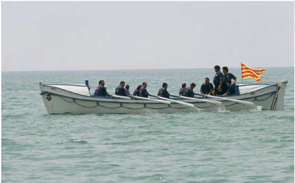
El Bot Salvavides navegant a rem.