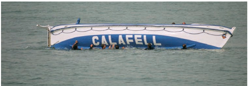
Demostració de la insubmergibilitat del bot.